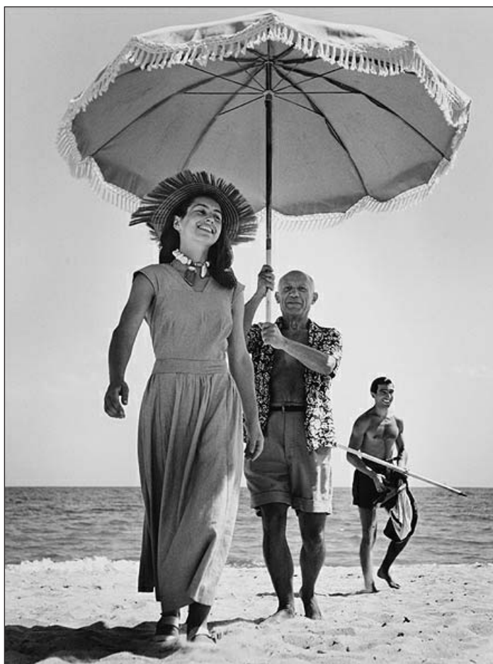
A Magyar Nemzeti Múzeum gyűjteményéből. Robert Capa (c) International Center of Photography, New York