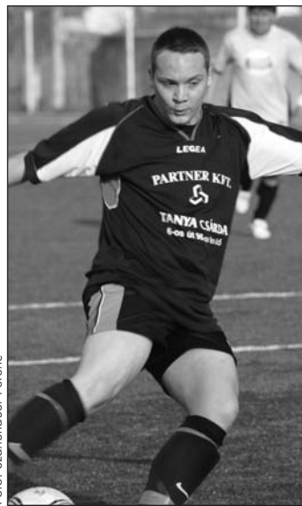
Fotó: Szaffencser Ferenc