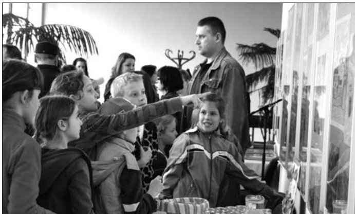
A világnap alkalmából rajzpályázatot is hirdetett a cég, az alkotásokból kiállítás is nyílt a művelődési házban.