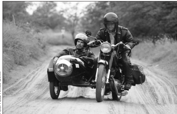
Ezúttal nem várják úttalan utak a pannoniás fiúkat.