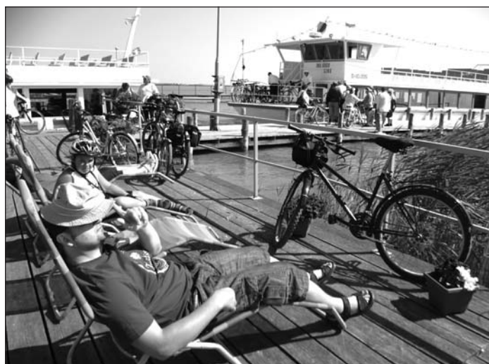
Behajózásra várva Fertőrákoson